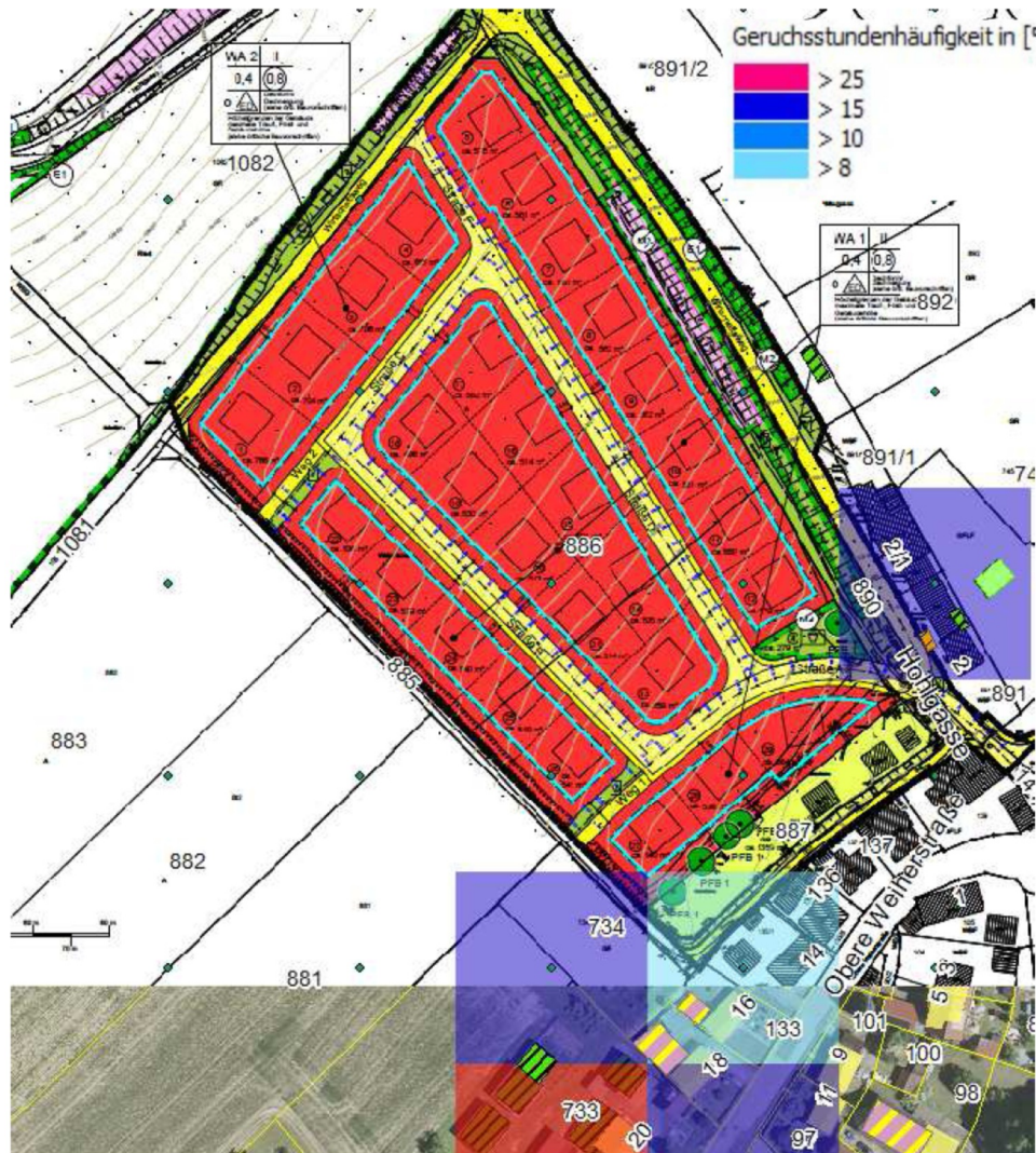
Geruchsabschätzung vom 15.10.2021- Landratsamt Alb-Donau-Kreis